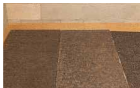
In caso di spessori elevati, posare CORKPAN