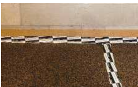
Nastrare le strisce tra di loro.