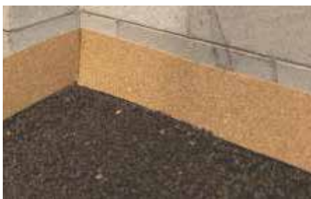
Applicare le strisce CORKFLEX sulle pareti verticali per risolvere ponti acustici.