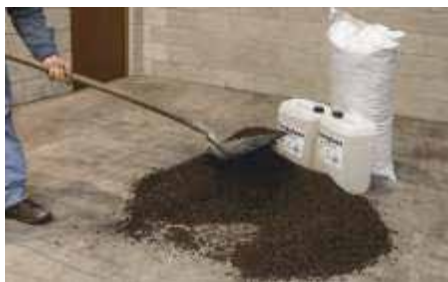
Miscelare 1 m 3 di CORKGRAN TOSTATO con 70 kg di vetrificante CORKGLASS.

Per realizzare sottofondi con cemento, mescolare in betoniera 1 m 3 di CORKGRAN TOSTATO con 200 kg di cemento 325.