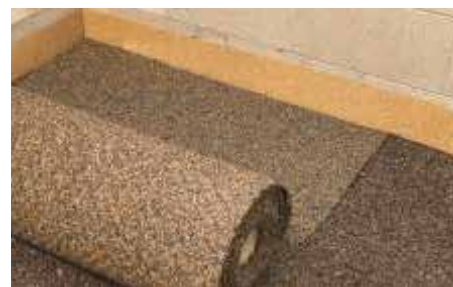
Disporre lo strato di isolamento acustico U32, U38 e U85 o COCCO PAV a tutta superficie.