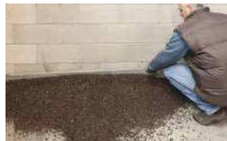
Stendere l'impasto e livellarlo con l'uso di una staggia.