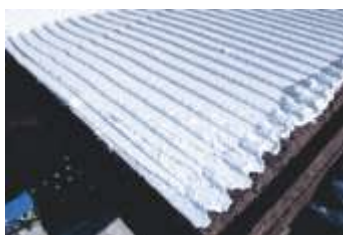
Stesura del collante sul pannello MD Facciata

La posa deve procedere per file orizzontali, dal basso verso l'alto.