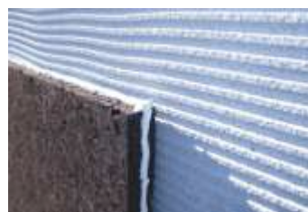
Premere i pannelli contro il supporto e posizionare il mastice prima di procedere con un nuovo pannello

I pannelli di sughero CORKPAN MD FACCIATA dovranno essere posati per file orizzontali, partendo dal basso verso l'alto, avendo cura di garantire l'allineamento orizzontale e accostando accuratamente i pannelli tra di loro.