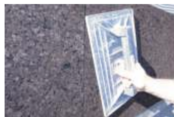
Verificare la planarità del supporto e correggere eventuali imperfezioni usando una talocchia pulita

Si consiglia di iniziare la posa da uno spigolo, posando i pannelli nella disposizione «testa a testa», sfalsando i pannelli. I pannelli di file adiacenti devono essere sfalsati tra di loro, per evitare la continuità delle fughe.