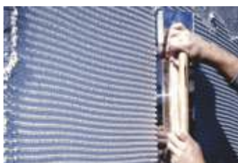
Stesura del collante sul supporto